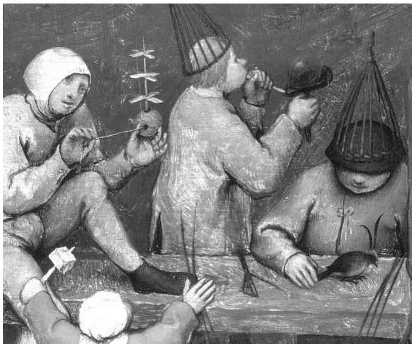
Ребенок забавляется игрушечным вертолетиком на картине Питера Брейгеля, 1560 г.

ряи своего значения: они точно так же необходимы, как раньше, и точно так же вдохновляют изобретателей.