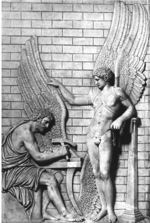
План бегства: Дедал делает крылья для своего сына Икара (барельеф на фризе, ок. 200 г. н. э.)